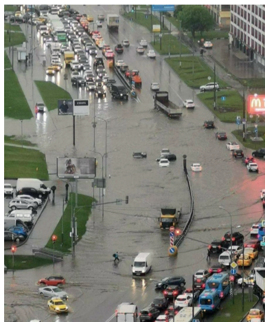
Многие жители в последние дни весны жаловались в нашу редакцию на часть Боровского шоссе, которое реально затонуло после проливного дождя.