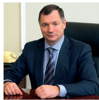
(На фото Марат Хуснуллин)

«Строительные работы на участке Калининско-Солнцевской линии метро от станции «Раменки» до «Рассказовки» практически завершены, заявил журналистам в субботу заместитель мэра Москвы по вопросам градостроительной политики и строительства Марат Хуснуллин. «Сейчас ведется пуск и наладка оборудования, монтаж инженерных систем. До конца первого квартала следующего года мы планируем запустить пассажирское движение на участке до «Рассказовки» в Новой Москве», - сказал М. Хуснуллин. Глава Стройкомплекса добавил, что на прошлой неделе на этом участке метро добавилось около 1,5 тыс. рабочих. «В ближайшее время на стройку будет мобилизовано еще около 2,5 тыс. метростроителей», - подчеркнул М. Хуснуллин. Он отметил, что на новом 15-километровом участке желтой линии метро расположатся семь станций: «Мичуринский проспект», «Очаково», «Говорово», «Солнцево», «Боровское шоссе», «Новопеределькино» и «Рассказовка».