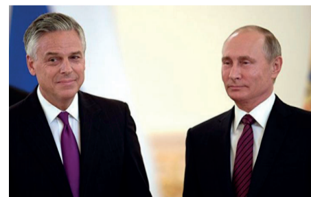
(На фото из соцсети Президент Владимир Путин и действующий Посол США Джон Хантсман)

«Здравствуйте, Сэр Джон Хантсман ! Обращаюсь к Вам от лица жителей Москвы, редакции официальных СМИ столицы России «НОВАЯ МОСКВА 24» и «ТиНАО», себя лично как гражданина Российской Федерации и Соединённых Штатов Америки. Хочу Вас поздравить с назначением на столь высокий пост представителя Америки в России. Огромная честь обращаться к Вам в начале Вашего пути. Сегодня непростые отношения между нашими странами. Надеюсь, что Ваш опыт и поддержка среди свободных граждан Америки, помогут восстановить добрые и перспективнейшие отношения двух Величайших стран мира. 1 августа 2017 года у посольства США отобрали склад, который использовало американское диппредставительство по улице Дорожная (дом 9Б) в районе Чертаново Южное, неподалеку от станций метро